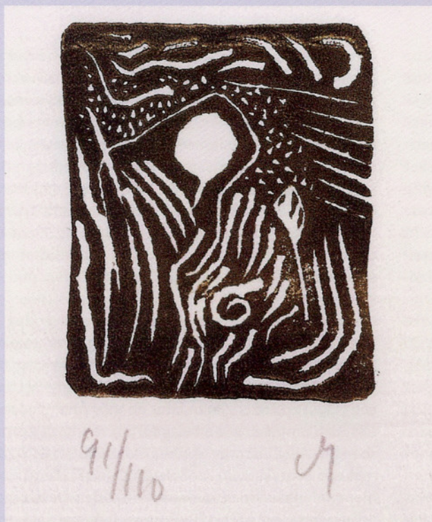
Henc van Maarseveen, Abstracte compositie, linoleumsnede, 1965.