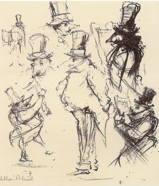
William D. Kuik, Schetsblad, bijlage bij 'Grafisch Gezelschap De Luis, tentoonstellingscatalogus Kunstzaal Van Stockum', Den Haag 1962, litho, 1962.